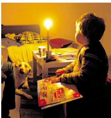
Bei manchen Menschen wird der Strom abgedreht, weil sie nicht genug Geld haben.

Die Leute schämen sich Stromfirmen haben in den letzten Jahren für viele Haushalte in Deutschland so eine Sperre verhängt. Vor allem Menschen ohne Arbeit sind davon betroffen. Oft schämen sie sich dafür und erzählen niemandem etwas von dieser Sperrung.